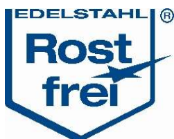
Legierungszuschläge Bleche in €/kg